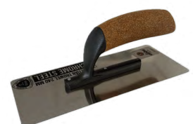
Spatola veneziana LOBA